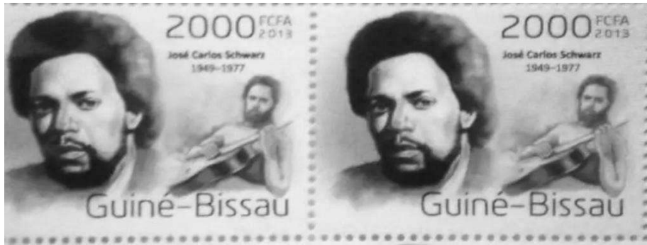
Briefmarken mit dem Bildnis von Zé Carlos