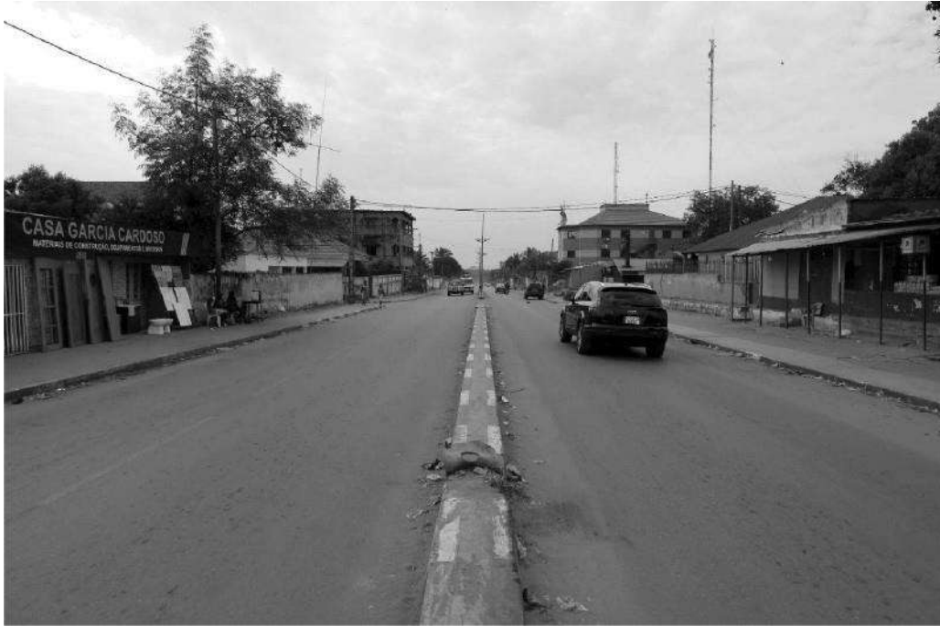
Straße José Carlos Schwarz in Bissau.

Nationale Musikschule José Carlos Schwarz, Kulturzentrum José Carlos Schwarz 47 , Rua José Carlos Schwarz, Fundação José Carlos Schwarz. 48 Es gibt sogar Briefmarken mit dem Bildnis von José Carlos Schwarz, die herausgegeben worden sind, als unser Land noch über einen Postdienst verfügt hat.