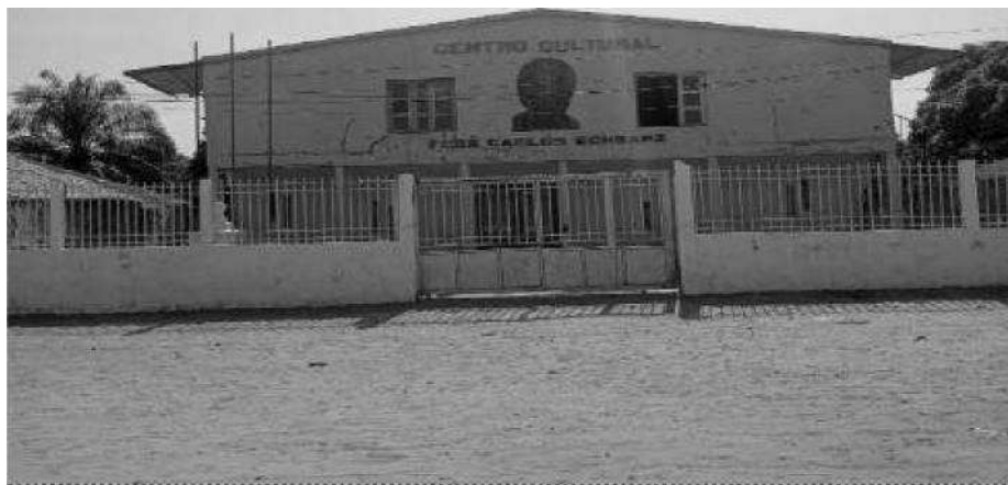
Kulturzentrum José Carlos Schwarz in Bor.