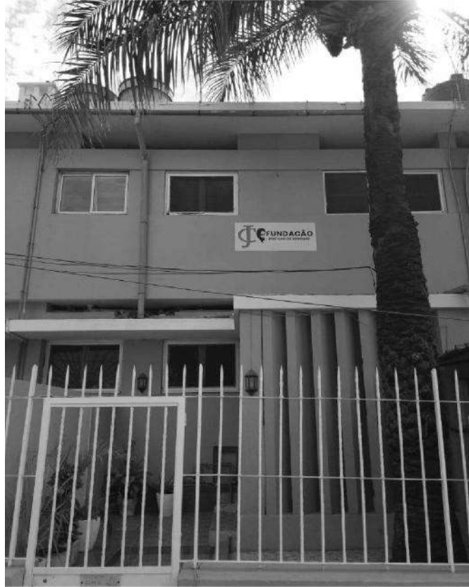
Sitz der Stiftung José Carlos Schwarz.