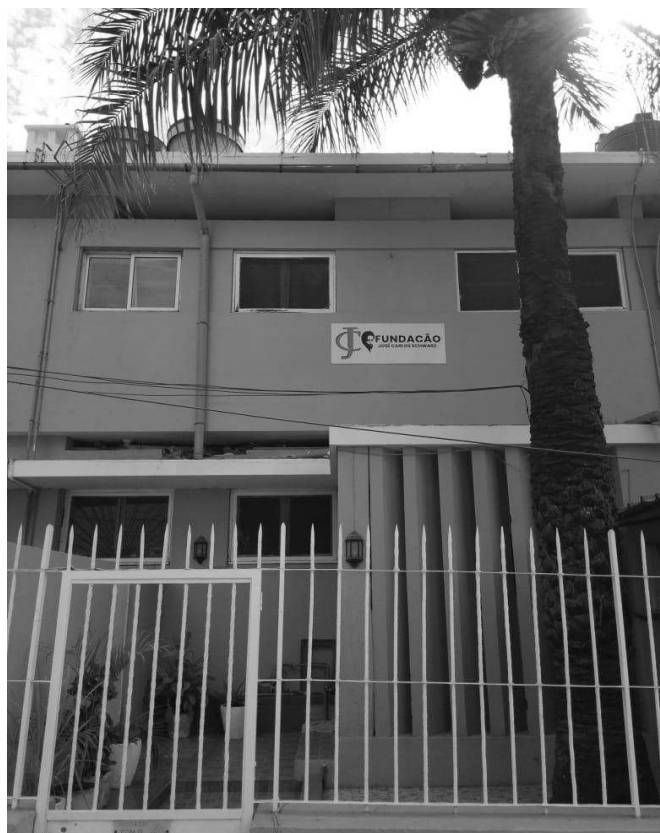
Sede da Fundação José Carlos Schwarz.