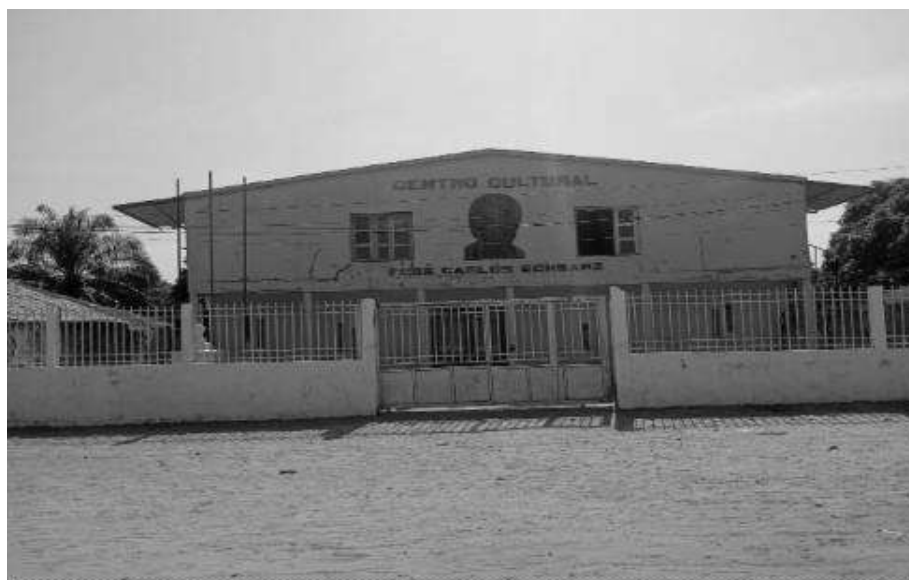
Centro Cultural José Carlos Schwarz em Bor.