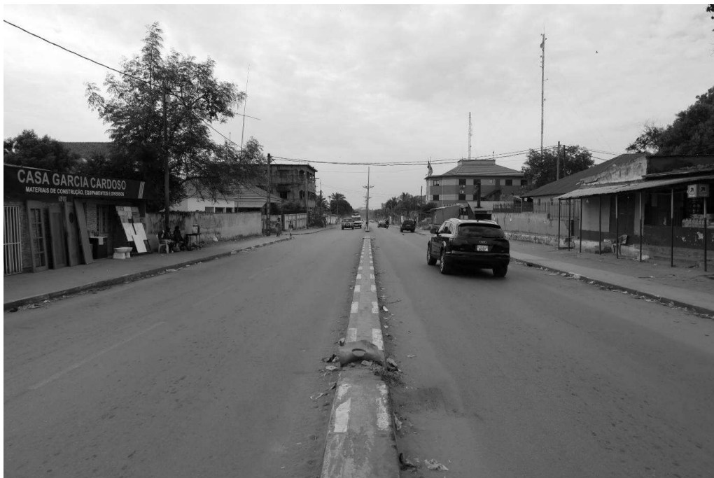
Rua José Carlos Schwarz em Bissau.

José Carlos Schwarz 47 , Rua José Carlos Schwarz, Fundação José Carlos Schwarz. 48 Existem também selos com a efígie de José Carlos Schwarz que foram editados quando o nosso país ainda tinha serviços postais.