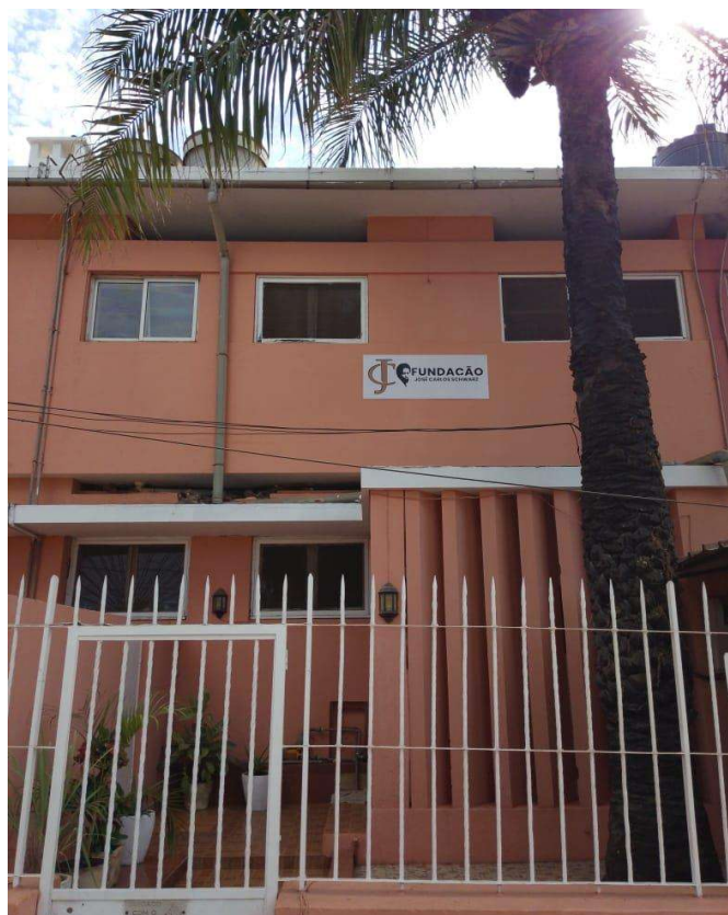
Sede da Fundação José Carlos Schwarz.