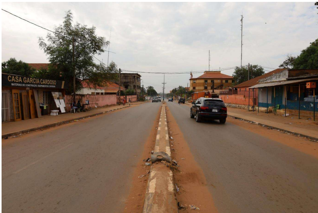
Rua José Carlos Schwarz em Bissau.

José Carlos Schwarz 47 , Rua José Carlos Schwarz, Fundação José Carlos Schwarz. 48 Existem também selos com a efígie de José Carlos Schwarz que foram editados quando o nosso país ainda tinha serviços postais.