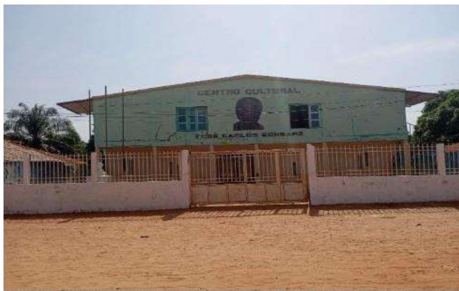
Centro Cultural José Carlos Schwarz em Bor.